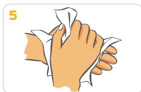
5 Hände gründlich mit einem Wegwerfhandtuch abtrocknen.