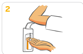
2 1-2 Pumpstöße auf eine Handfläche geben.