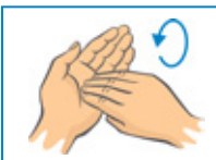
Bouts des doigts